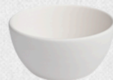
salaterka 05 H7,5cm | Q16cm | V0,65L