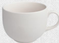
kubek 8 H9cm | Q12cm | V0,5L