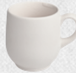
filizanka espresso 01 H6,5cm | Q6,5cm | V0,1L