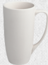
kubek03 H14,5cm | Q8cm | V0,38L