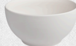
salaterka 07 H9,5cm | Q19cm | V1,4L