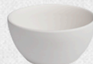
salaterka 02 H6cm | Q11,5cm | V0,3L