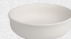
rondel mały H4,5cm | Q16,5cm | V0,35L