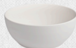
salaterka 06 H7cm | Q18cm | V0,85L