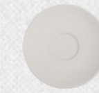
spodek 03 Q 12cm