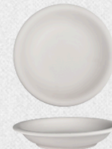
talerz głęboki H4,5cm | Q22,5cm | V0,5L