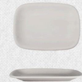
talerz prostokątny 03 H3cm | 25cmx17,5cm