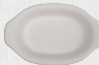
półmisek głęboki H4,5cm | 32cmx20cm