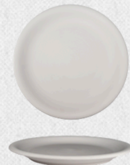
talerz płytki 03 H3,0cm | Q26cm