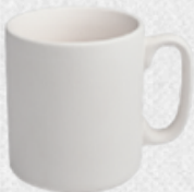
kubek 9 H9,5cm | Q9cm | V0,38L