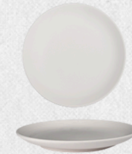
talerz deserowy 02 H2,5cm | Q19cm