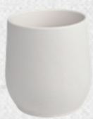
kubek 6 H9cm | Q9cm | V0,3L