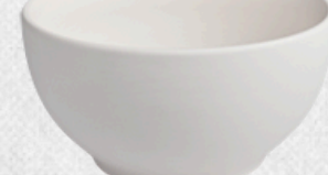
salaterka 08 H12cm | Q23,5cm | V2,9L