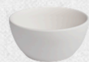
salaterka 01 H5cm | Q10cm | V0,2L