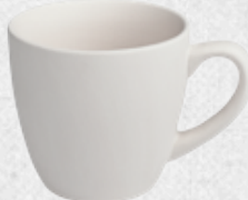
filizanka H8cm | Q8cm | V0,22L