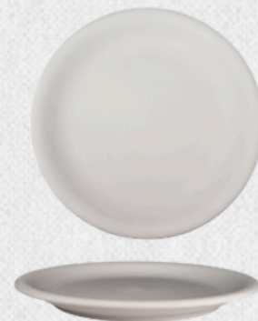
talerz płytki 02 H3,5cm | Q29cm