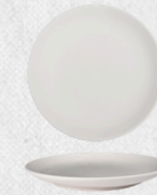
talerz deserowy 01 H2,5cm | Q17cm