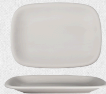
talerz prostokątny 01 H3cm | 34cmx 24cm