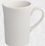
kubek02 H10cm | Q7,5cm | V0,22L