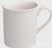
kubek 10 H9cm | Q8,5cm | V0,25L