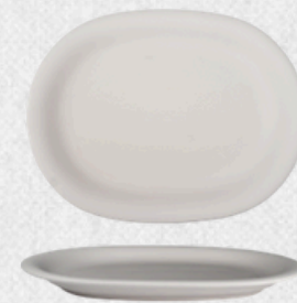
talerz owalny H3,5cm | 29cmx21cm