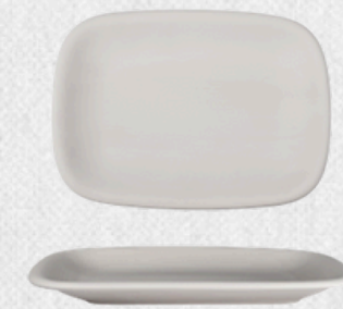
talerz prostokątny 02 H3cm | 29cmx20,5cm