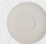
spodek 01 Q 14cm