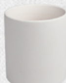
kubek 7 H9,5cm | Q9cm | V0,38L