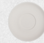
spodek 02 Q 14cm