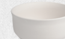
rondel duży H7cm | Q16,5cm | V0,75L