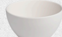
salaterka 03 H6cm | Q13,5cm | V0,4L