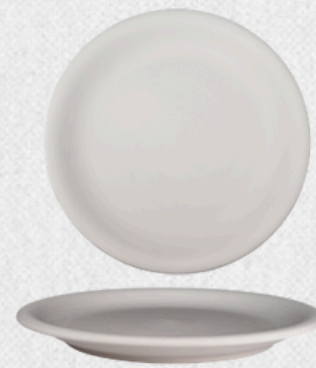
talerz płytki 01 H3,5cm | Q32cm